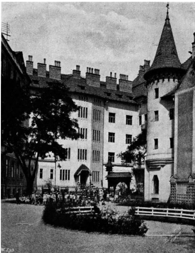
Az iskola udvara az 1910-es években