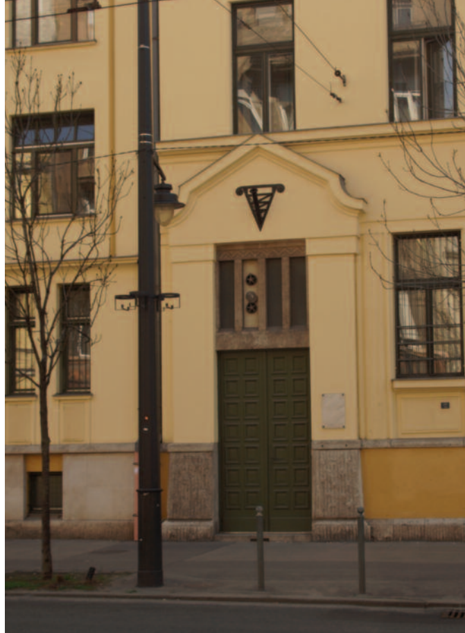
A Pedagógiai Szeminárium főigazgatói lakosztályának kapuja napjainkban

1932-ben a gyakorló elemi iskola helyettes igazgatója, 1935-től pedig igazgatója lett. 1943-ban még magasabb rangra emelkedett, a Pedagógiai Szeminárium főigazgatójává nevezték ki (1943–1950). Ekkor költözött be az iskolaépület Ba-