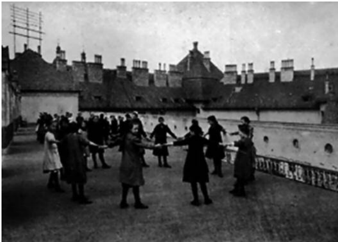
Játszótér a tetőterazon a mai 417–420. termék helyén

pok és ketrecekben, akváriumokban, terráriumokban tartott eleven állatok szolgálták. A Biológiai Laboratórium vegyszereiből, vegyszeresüvegeiből néhány a mai napig a Fazekas kémiantárainak használatában van.