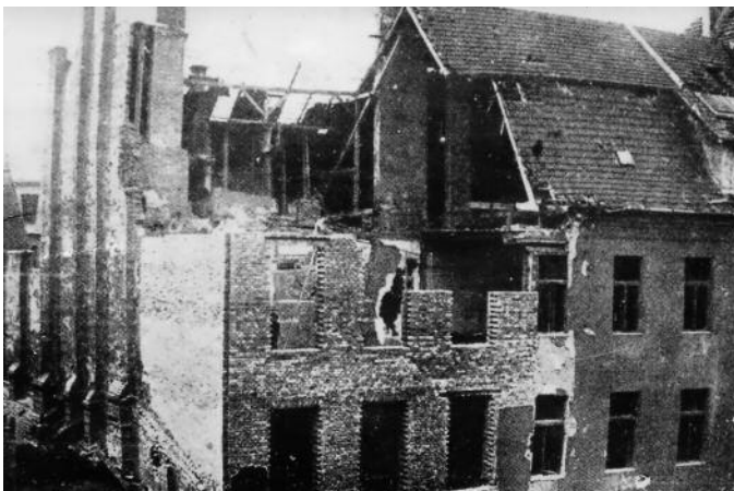
Az iskola 1945-ben a Baross utca szemközti házából fotózva

a megváltozott társadalmi viszonyok között a Budapesti Pedagógiai Főiskola tanáraként, majd tudományos kutatóként tankönyvírással keresgélte helyét a tőle idegen szocialista rendszerben.