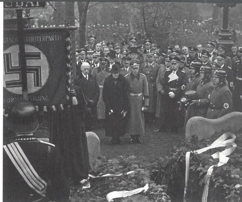
SA-díszórség kísérette utolsó útjára a „zsidó világösszeszervezők” áldozatául esett Ernst vom Rathot 1938. november 17-én

azaz a zsidóság győzelme lesz, hanem a zsidó faj elpusztítása egész Európában.”