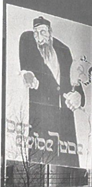
Az antiszemita propaganda időnként tudományos köntösbe bújt: „Az örök zsidó” című 1937-es kiállítás óriásplakátja

E lengyel zsidókat, mintegy 16 ezer embert a rendőrség és az SS összetelrelt és Zbąszyń városka közelében egyszerűen átrakta a határon, ahon-