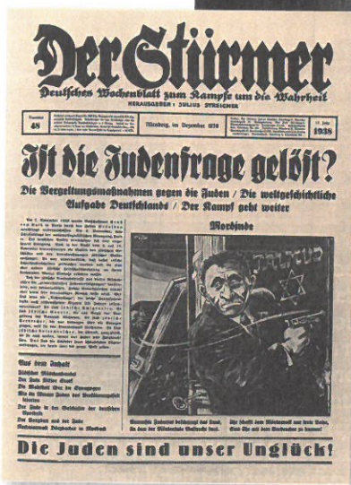
A Der Stürmer december közepi címlapja: „Megoldódott a zsidókérdés?” A TÚLOLDALON: Egy kiegészített berlini zsinagóga a Heideutergassén BALRA: Egy járókelő egy betört és kifosztott kirkat előtt Berlinben, másnap reggel

nan a lengyel határőrök visszaküldték őket – egy darabig a két határ közötti senki földjén álltak és vártak, hidegben és szakadó esőben. A Grynszpan családot Hannoverből üzték el október 27-én. Fiuk, Herschel nem volt velük, Párizsban rejtőzködött, de megkapta Berta nővére levelét, amely beszámolt a család sorsáról. November 7-én Herschel azt írta: „Vérzik a szívem, amikor a mi tragédiánkra és a többi 12 ezer zsidó tragédiájára gondolkodom. Tiltakoznom kell, olyan módon, hogy az egész világ megértse a tiltakozásomat.” Ugyanazon a napon pisztolyt szerzett, elment a német követségre, ahol több lövéssel halálosan megsebesítette Ernst vom Rath első titkárt. Rath két nappal később, november 9-én délután meghalt (düsseldorf-i temetésén Hitler is jelen volt, bár nem beszélt). A német sajtó azonnal, egyöntetűen, és a címlapokon a „világzsidóság összeesküvését” és merényletét emlegette, s megtorlással fenyegetett. (Nem világos, mi történt a háború végén Herschel Grynszpannal, akit a sachsenhausen-i koncentrációs táborban őriztek.)