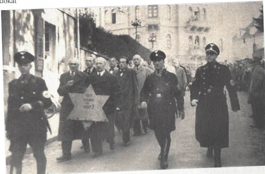
Sárga csillaggal menetelésre kényszerített zsidók november 10-én

igazolvány viselésére kötelezték, és útlevelüket „J” betűvel pecsételték le. Attól a naptól fogva a zsidó férfiaknak az „Izrael”, míg a zsidó nőknek a „Sára” névvel kellett kiegészíteniük saját utónevüket. Néhány nappal e rendeletek életbe lépését követően Hitler közölte József Beck lengyel külügyminiszterrel: szilárd elhatározása, hogy „kiviszi a zsidókat Németországból”. Hozzátette: most még magukkal vihetik vagyonuk egy részét, de „minél tovább késlekednek, annál kevesebbet vihetnek majd magukkal”. Majd 1939. január 30-án, a hatalomátvétel hatodik évfordulóján a Reichstag előtt kijelentette, hogy mint már oly sokszor, ezúttal is próféta szeretne lenni: „Ha az európai és azon kívüli nemzetközi finanszsidóságnak sikerülne még egyszer világháborúba dönteni a népet, akkor annak eredménye nem a Föld bolsevizálása,