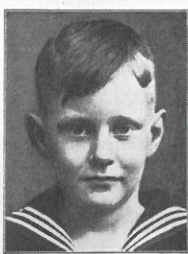
Abb. 25 a, b. Schwabwig, Daffn und Binn mod finländk