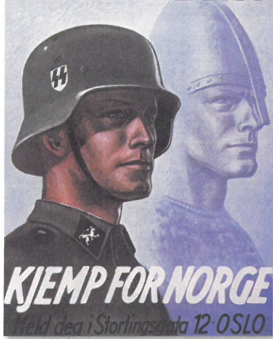
Norvég Waffen SS toborzóplakát

orvosok is működtek, akiknek a jelek szerint nem okozott lelkiismereti problémát, hogy nem azzal foglalkoznak, amire egykor fölesküdték.