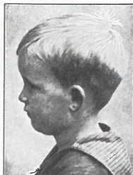
Abb. 24 a, b. Tischerhofen, Nordik. Östrik och finländk nordik. Stern, Daffn und Anform mod finländk