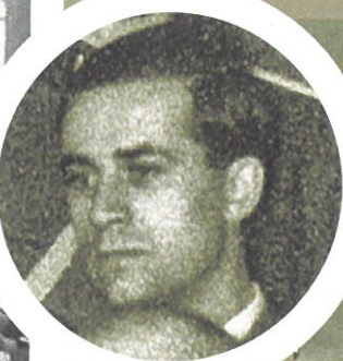
Szilveszteri partira érkezett vendégek a Berghofban, 1939. december 31-én. Fent kiemelve Karl Brandt, az eutanáziaprogram egyik végrehajtója, később az orvosi kutatási programok vezetője. A nürnbergi orvosperben ítélték halálra, 1948-ban végezték ki