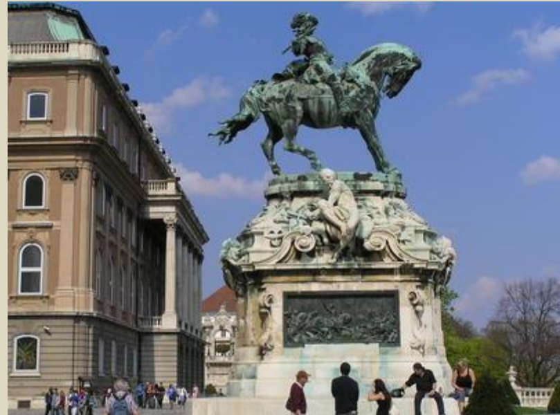
Róna József szobra (1900 körül)