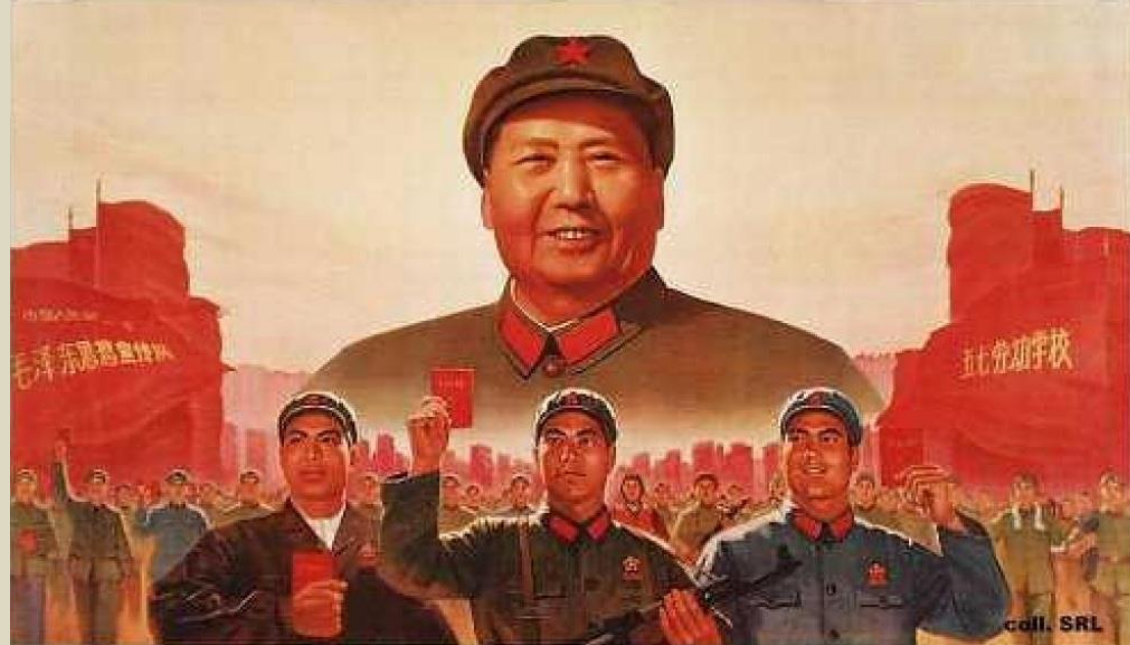
MAO, a Nagy Tanító, a Nagy Vezér, a Nagy Kapitány, a Nagy Kormányos