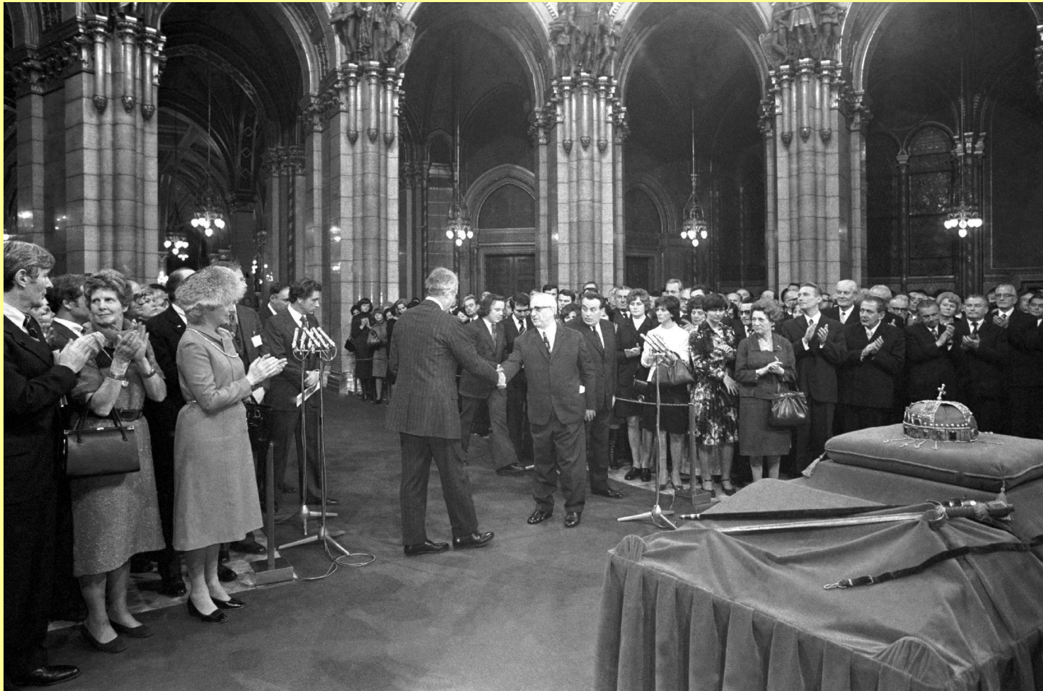
Apró Antal, az Országgyűlés elnöke átveszi a koronát Cyrus Vance amerikai külügyminisztertől az Országház Kupolacsarnokában (az amerikaiak kikötötték, hogy ne Kádár János fogadja)