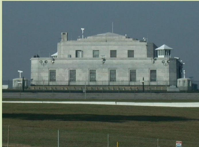
A Szent Korona őrzési helye: a Fort Knox katonai támaszpont