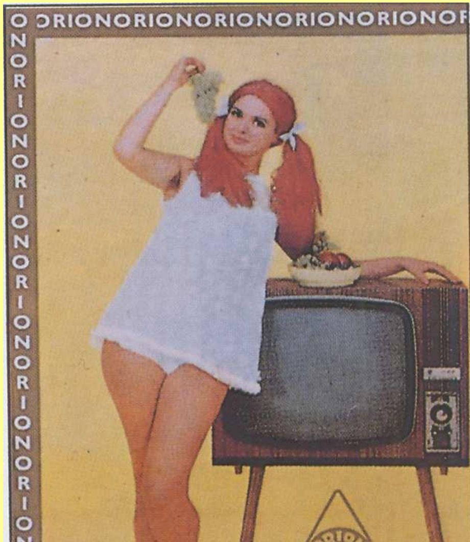
Orion televízió reklámja