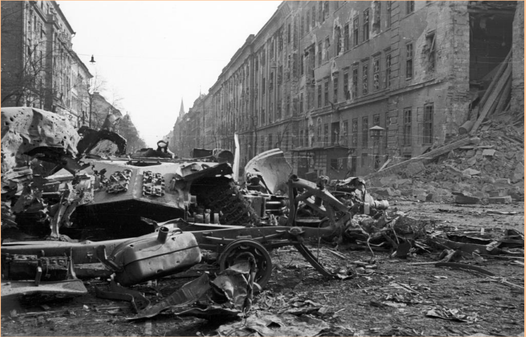
A Kilián laktanya