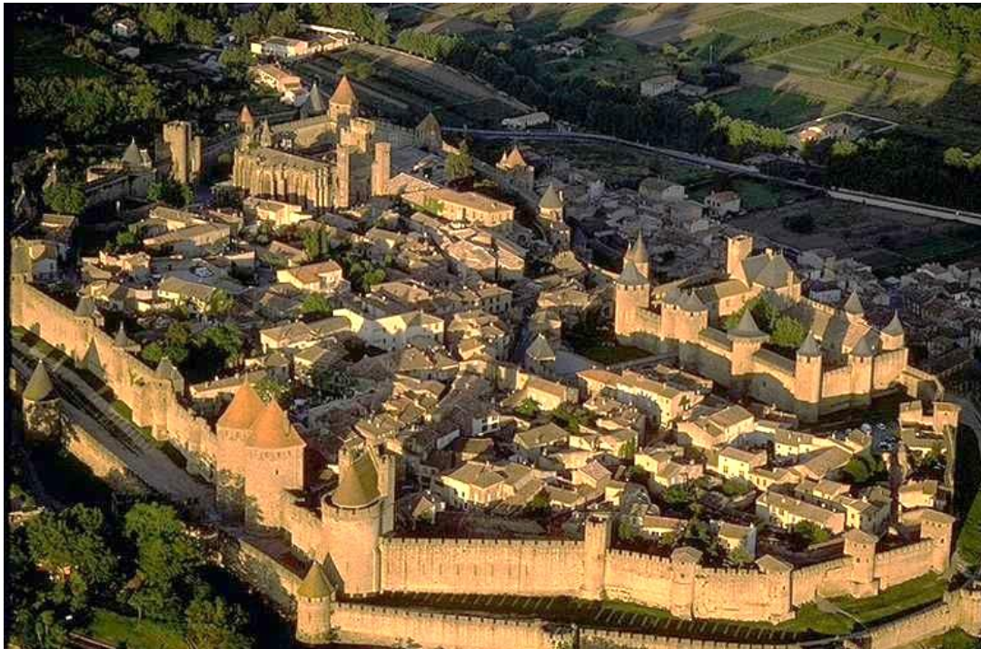
(Carcassonne városa - Franciaország)

„Ha egy férfi vagy nő Bréma városában [...] egy évet és egy napot háborítatlanul eltöltött, annak, aki ezután szabadságát el akarná venni, hallgatást parancsoljanak. Neki pedig jogában áll szabadságát megtartani, minthogy az ezzel szemben (esetleg) fennálló jogok az említett idő alatt elévülnek;” (I. Frigyes német-római császár kiváltságlevele, 1164)