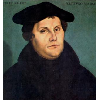
id. Lucas Cranach: Luther Márton