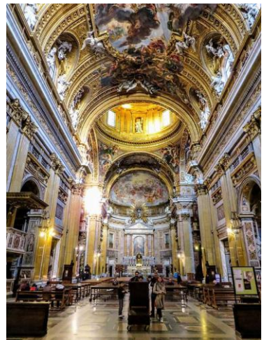
Az Il Gesù, a jezsuiták római főtemploma