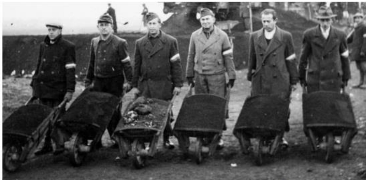
Munkaszolgálatosok a fronton, 1943

„Nincsen szükség arra, hogy a tengelyhatalmak melletti politikánk újabb demonstrálása végett vegyünk részt az esetleges német–orosz háborúban. [...] A német kormány állítólagos háborús elhatározásaira [a Szovjetunió esetleges megtámadására] vonatkozó híreszteléseknek, legalább is egyelőre nincsen semmi alapjuk.” (Bárdossy László miniszterelnök, 1941. június 14.)