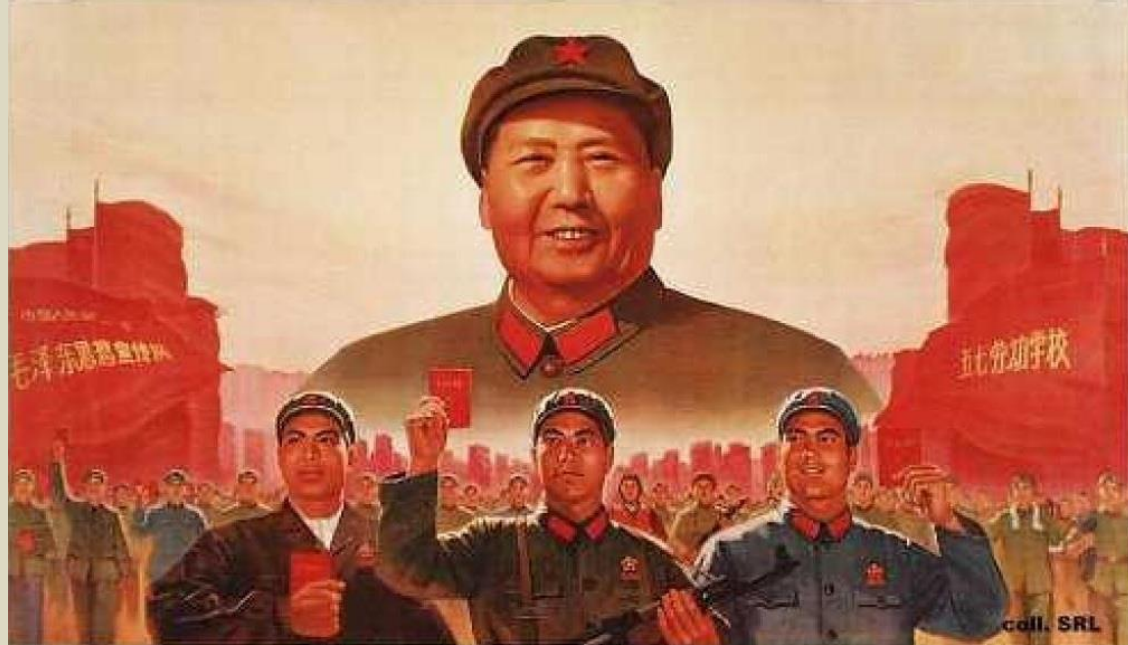
MAO, a Nagy Tanító, a Nagy Vezér, a Nagy Kapitány, a Nagy Kormányos