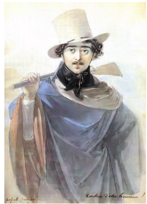
Johann Ender 1818-i akvarellje (MTA)