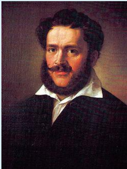
Barabás Miklós festménye