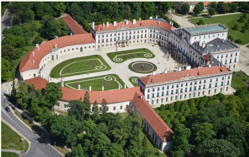
Eszterháza (Fertőd), Esterházy-kastély