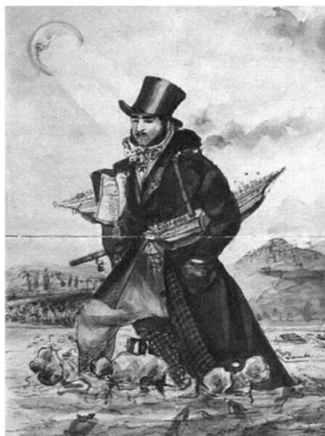
Korabeli karikatúra Széchenyiről

„Hunnia minden lakosinak polgári létet adni! – ím, ez, amit 1832-ben teljes meggyőződésem szerint honunkra nézve nemcsak nem idő előttinek, sőt szinte már idő utáninak tartok. [...] Magyarországon mindenki bírhat ingó és ingatlan jószágot [vagyont] mint sajátot. [...] Mindenki egyenlőn áll a törvény oltalma és súlya alatt.” (Széchenyi: Stádium, 1831)