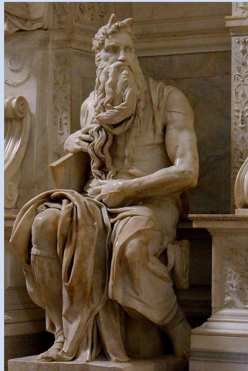
Michelangelo: Mózes (II. Gyula pápa síremléke, San Pietro in Vincoli, Róma)