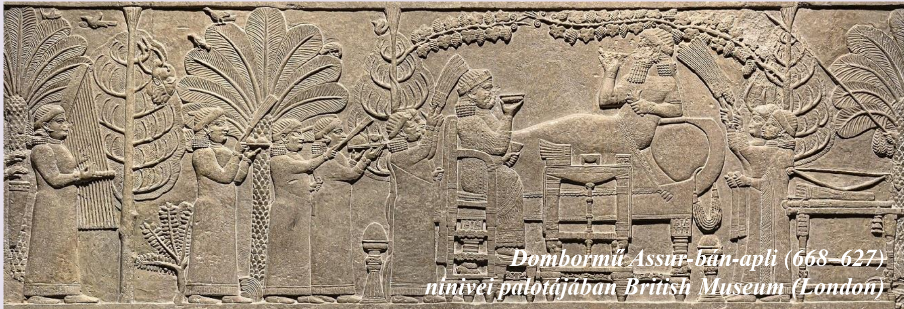
Dombormű Assur-bán-apli (668–627) nínivei palotájában British Museum (London)