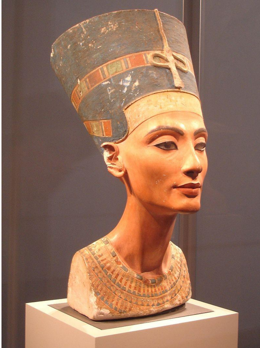
Nofertiti ( Neues Museum, Berlin )

Tutanhamon trónusának háttámlája ( Egyiptomi Múzeum, Kairó )