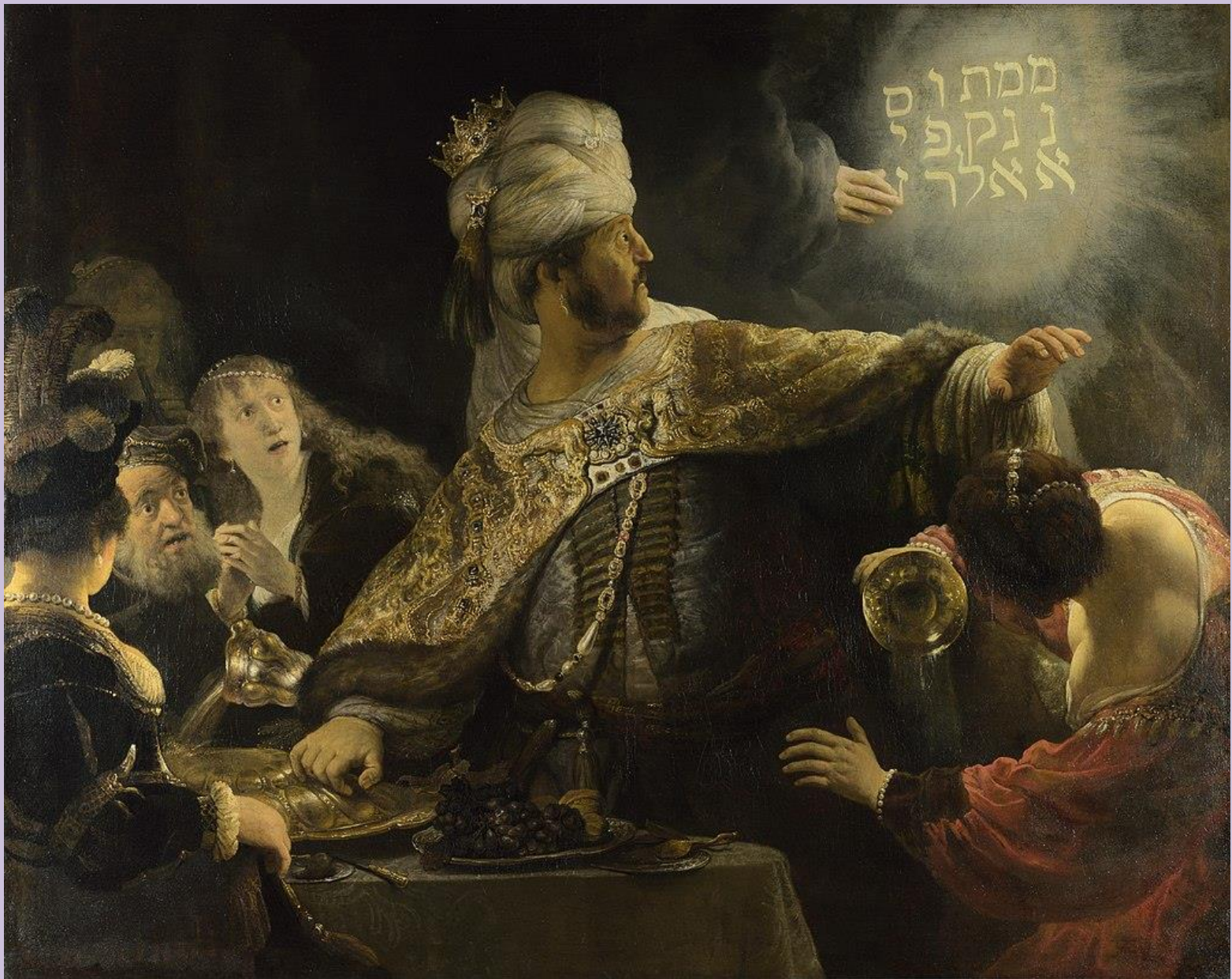
Rembrandt: Baltazár lakomája (1635, National Gallery, London )