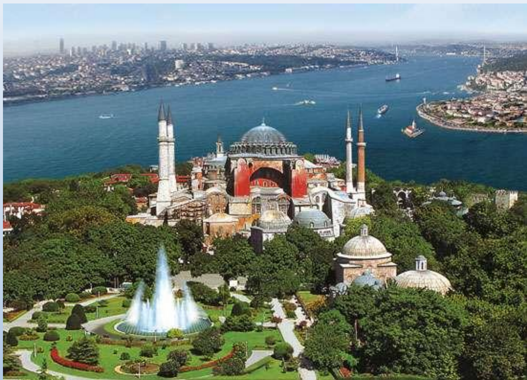
Hagia Sophia (Isztambul)