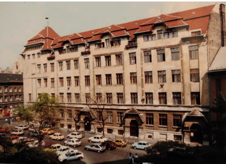
Az iskola az 1990-es évek közepén

avatták fel a gólyákat szórakoztató feladatokkal igazi fazekasos diákká, majd utána felléptek a zenekarok, ezek távoztával pedig diszkó folyt egészen a program végéig.