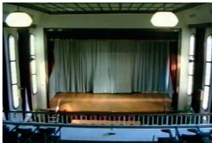
A nagyterem az 1997–1999. évi felújítás előtt

Elsőként az 1996. november 7-i Lúdas Matyi-előadásról maradt fenn részletes dokumentáció. Az osztályok plakátjait túlnyomórészt kézzel rajzolták, és nem volt sok korlátozás a méretükkel és elhelyezésükkel kapcsolatban, így szinte bármilyen formájúak lehettek, és bármely elérhető falfelületen elhelyez-