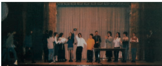
Az 1997-es Matyi helyszíne a Vasas Művelődési Ház volt

Az 1998-as Lúdas Matyit a gólyabál után, november 6-án,