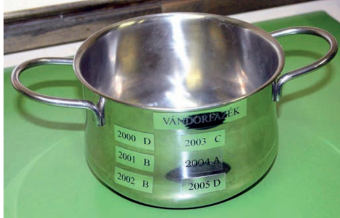
A vándorfazék (2006)

pénteken rendezték meg. Ez az év több szempontból is fontos volt, mivel a frissen felújított nagyteremben vetítovászon is helyet kapott, amit előszeretettel használtak az előadások során. Az ez évi gólyabált szokatlan módon október 16-ára, majdnem egy hónappal a Lúdas Matyi elé helyezték. Az előző