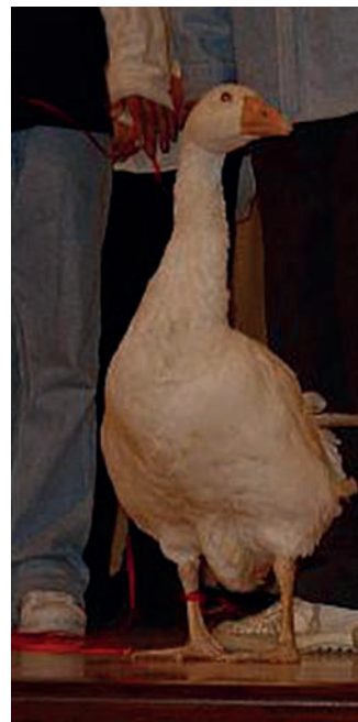
Lufikkal töltött, és valódi lúd a B osztály indulóján (2004)